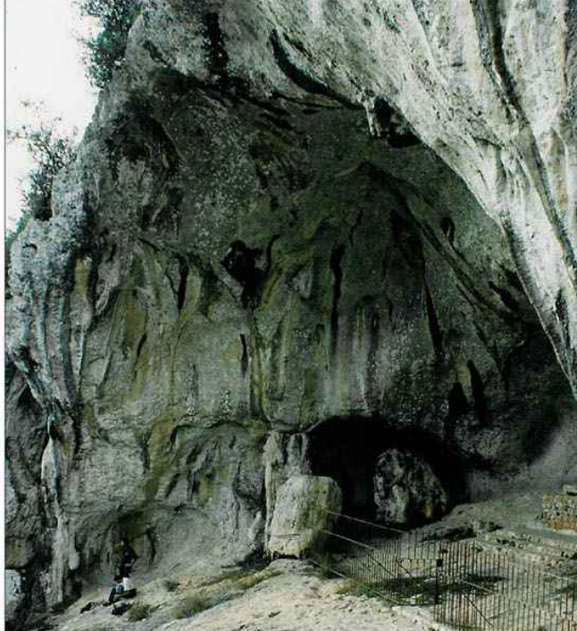
▲ "Pia da Ovelha"